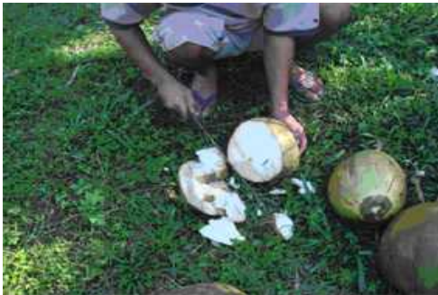
取れたてのココナッツジュース ぬるいの一言