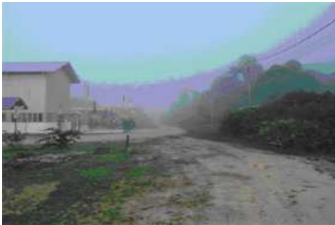
阿朝6時の村の状態です。霧が立ち込めていました