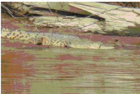
村から遠くないところに2メートルのワニがいました。 4mくらいの近さで見られましたがすぐに水の中に逃げていきました。