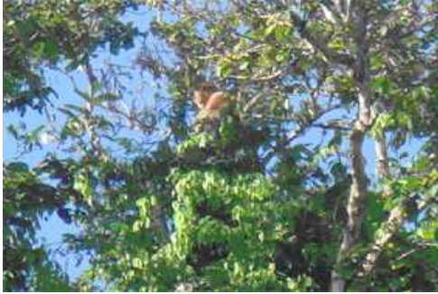
めったに見ることができないという天狗猿。 何枚も写真を撮っているとカメラ目線で撮らせてくれました。