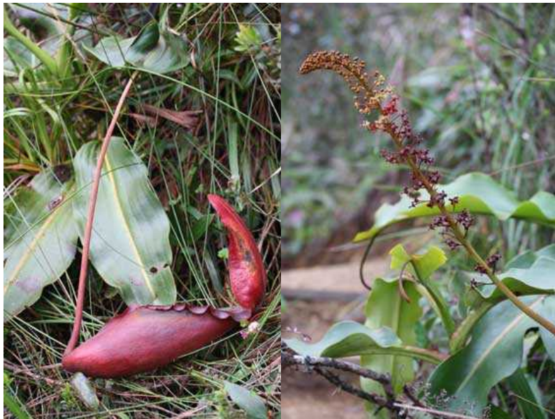
図 3 : Nepenthes rajah の捕虫葉および花序 .

pH の測定— pH は自生地において Twin pH B-212 (HORIBA Co.) を用いて計測した. それぞれの捕虫葉につき 3 回ずつ測定を行い, 平均値を算出した. また蓋が開いてからのおよその目安となる消化液の粘性および色相を観察した.