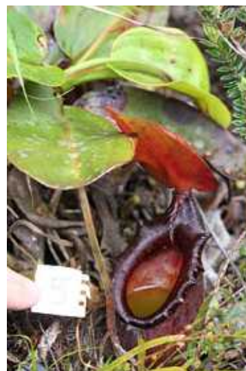
図 4. 消化液の様子

捕虫葉の消化液の pH, 粘性, 色相は表 1 に示した。捕虫葉の蓋が開いておらず, 外界の影響を受けていない消化液の pH は, 4.6 と酸性であった。蓋が既に開いている捕虫葉の pH は 5.5 – 8.2 となり, 必ずしも酸性ではない結果が示された。粘性は pH の低い捕虫葉で高く, pH の高い捕虫葉では低かった。色相はほとんどの捕虫葉で無色透明であったが, pH の比較的高い数個体で緑色から茶褐色に着色していた(図 4)。また粘性と色相には関連は見られなかった。