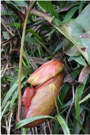
図 5. 蓋が開く前の捕虫葉。

いう報告はない。消化液の粘性や色相から判断すると、蓋が開いてから時間が経つに連れて pH は上昇する傾向にあるようだ。事実、消化液の酸性成分は昆虫由来の有機酸ではなく、塩化物イオンであるという報告がある (Morrissey, 1955)。つまり蓋が開いた直後の消化液は、もともと消化液として分泌される塩化物イオンのために酸性となっているのである。